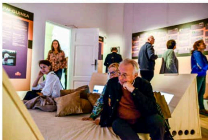
Kijken en luisteren naar de verhalen van 33 geïnterviewden in de expositieruimte van 'Tabee Nieuw-Guinea'.

'Op Biak ben ik weer voor het eerst van de zon gaan genieten'